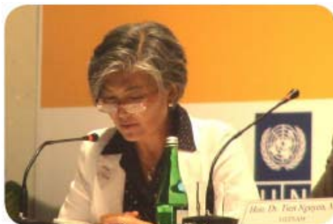
Ms Kyung-wha Kang UN Deputy High Commissioner for Human Rights

La Comisión Nacional de los Derechos Humanos (CNDH) y la Alta Comisionada Adjunta de la ONU para los Derechos Humanos coordinarán sus acciones con el fin de mejorar el respeto, promoción y protección de las garantías fundamentales en México.