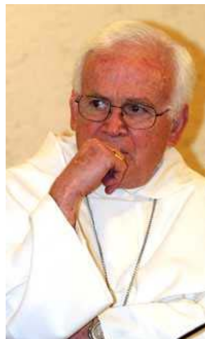
Imagen de archivo del obispo de Saltillo

Periódico La Jornada Sábado 21 de agosto de 2010, p. 15